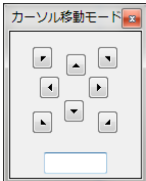
カーソル移動モードダイアログ

キャンセル (中止) は【ESCキー】またはマウスで直接クリックします また割り込みウィンドウの【中止】からできます